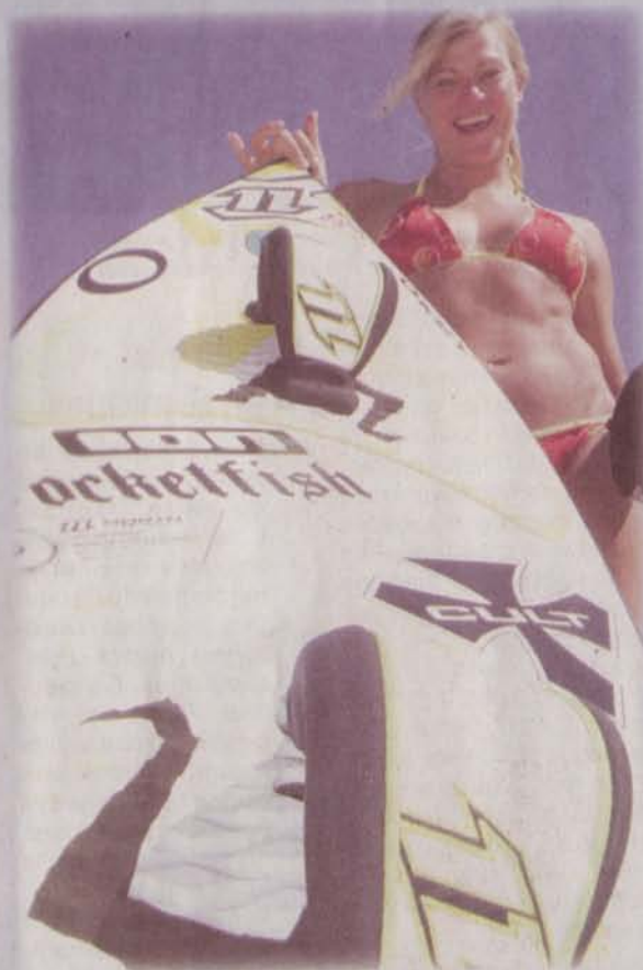
Gabriele Steindl, championne autrichienne de kite surf